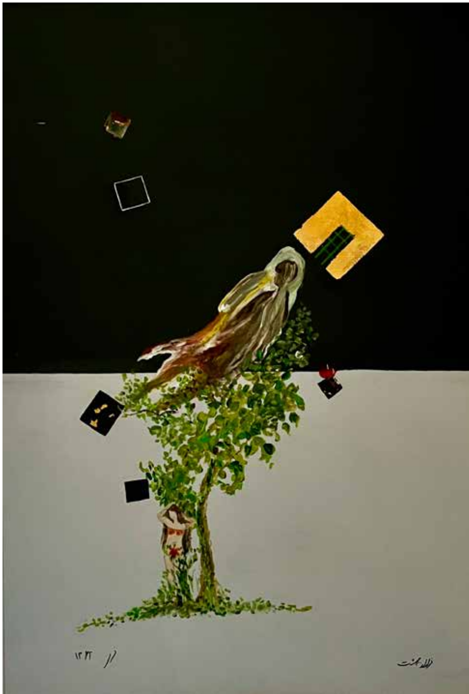
Vertreibung aus dem Paradies.

kömmlinge als Staatsbürger eingebürgert werden.