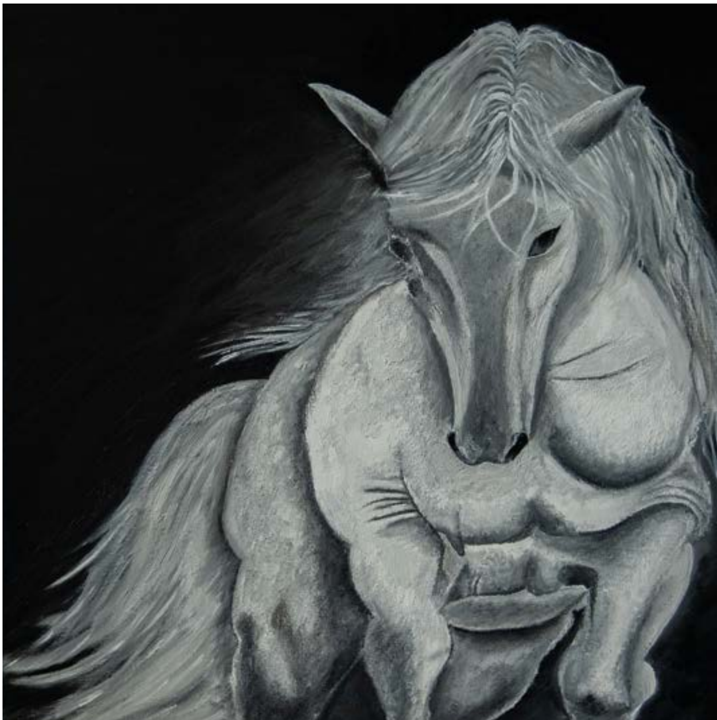
Elahe Janavi: White Dream .

geduldete Dublin-Fälle. Erst recht gilt das natürlich für einen vollständigen Ausschluss gem. § 1 Abs. 4 AsylbLG.