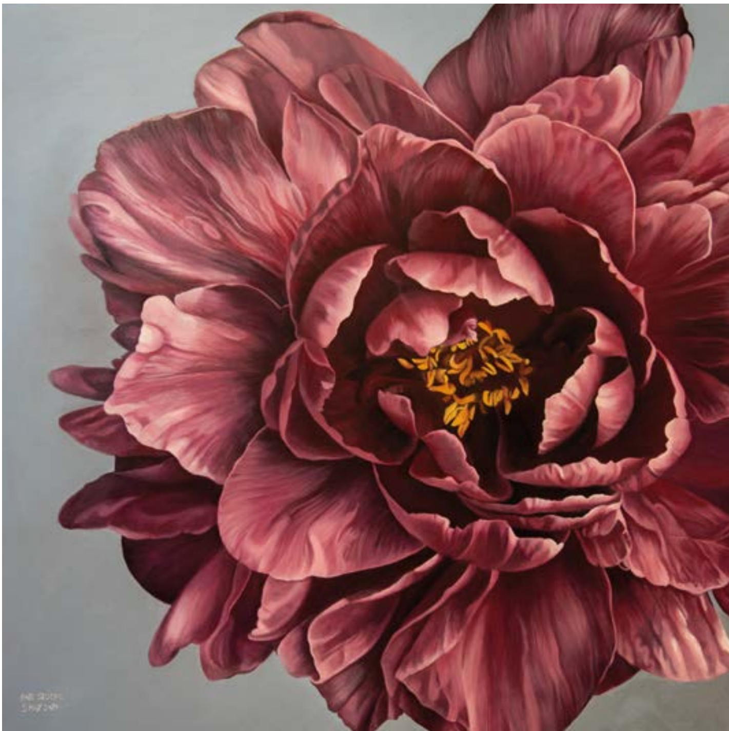
Pardi Sedghi: Memory.

Man hat den Eindruck: Die rechte Agenda, den sozialstaatlichen Gewährleistungsanspruch für Nicht-Deutsche schrittweise zu schleifen, soll nun Schritt für Schritt abgearbeitet werden. Die ersten Diskriminierungsvorhaben durch Einführung der Bezahlkarte und Verlängerung des niedrigeren Grundleistungsbezugs nach § 3 AsylbLG sind schon abgehakt worden. Nun stehen die Leistungskürzungen bzw. -streichungen für Dublin-Fälle als nächstes auf der noch langen TOP-Liste.